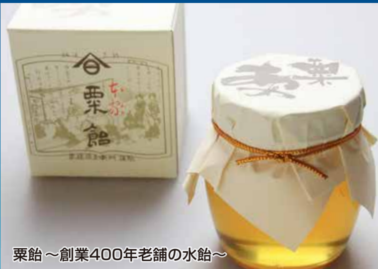
栗飴～創業400年老舗の水飴～