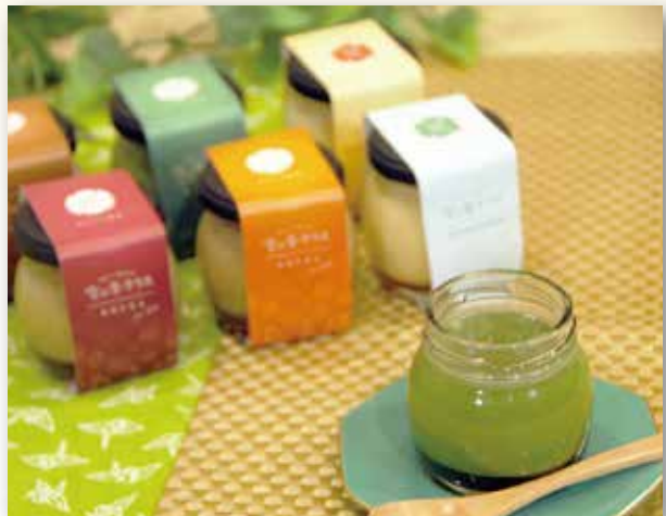
雪の中で熟成した茶葉を使った雪室プリン