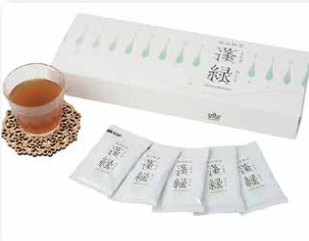
自然素材がたっぷり溶け込んだ酵素ドリンク