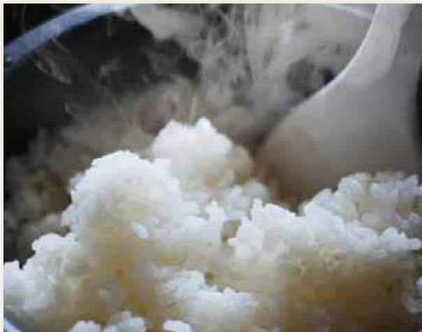
棚田でていねいに育てたコシヒカリ