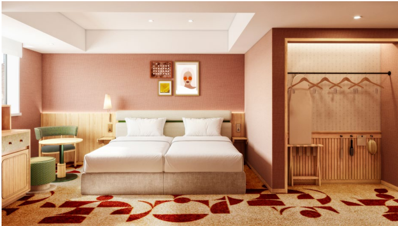
「ザ ロイヤルパークホテル 銀座6丁目」客室一例